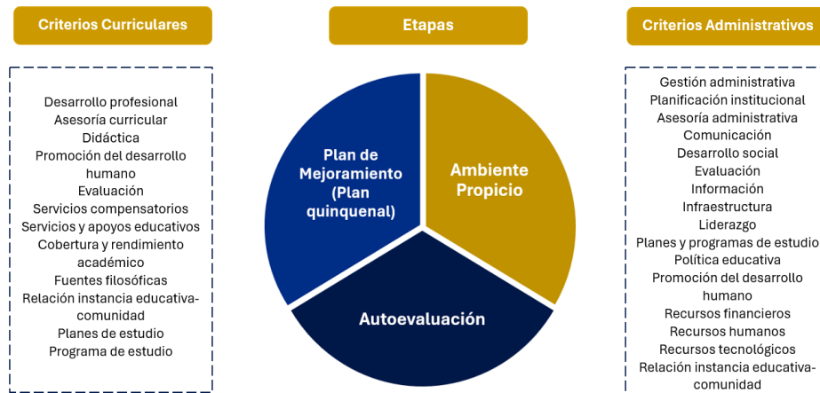
Figura 2 Criterios y etapas del Modelo de Evaluación de la Calidad de la Educación MECEC