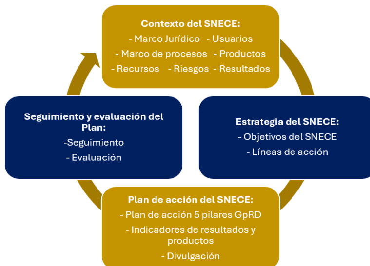
Figura 1 Plan de Calidad del Sistema Educativo Costarricense 2025-2030